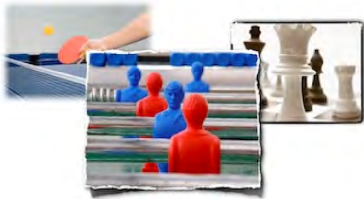
Triathlon Trofeo Velasca: scacchi, calciobalilla, tennis tavolo