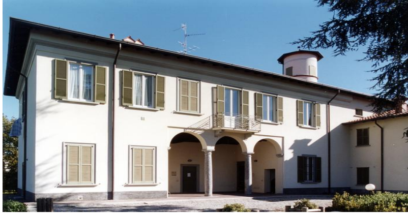
Villa Volontieri - via Velasca, 22 Vimercate (MB)